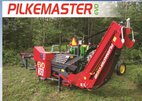
PROCESSEUR À BOIS