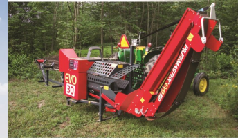
PROCESSEUR À BOIS

Les Jardins de l'Arbour sont à la recherche de vieilles machineries ou de l'outillage agricole fonctionnant par traction ou tout simplement à force de bras.