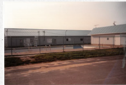
Piscine publique de St-Zéphirin

Le mois dernier, nous vous parlions de l'inauguration de la piscine municipale en 1976.