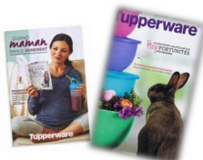
Livres de recettes et brochure février