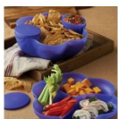
Ensemble à trempette