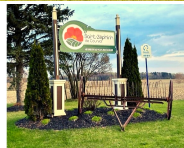
Don de Ferme Andrel et fils